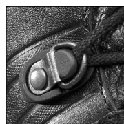
HAIX® 2-Zone Lacing