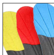
Vario Wide Fit System