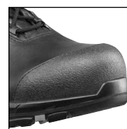
HAIX® Composite Schutzkappe