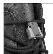
HAIX® Smart Lacing